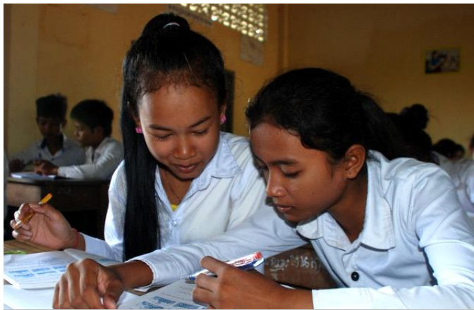
Education for Women and Girls